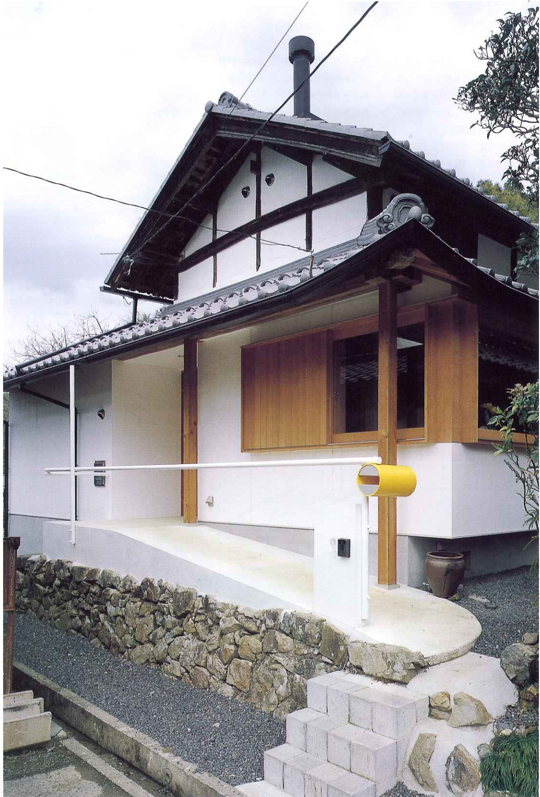
西側のアプローチより見る。既存の屋根のかたちを生かし、もとの縁側だった部分を内部化し横連窓とした。玄関位置は南から西に移動し、スロープによるアプローチとしている。右真 居間・食堂、吹抜けを介して上階の子供室とつながる。大テーブルも設計者によるデザイン